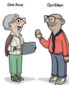
Grafik: Studio Animanova